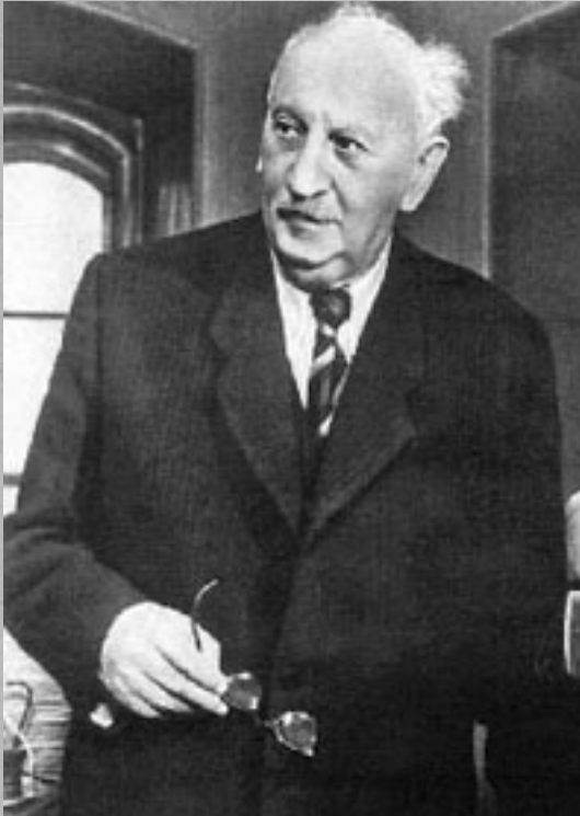
Абрам Федорович Иоффе (1880-1960)