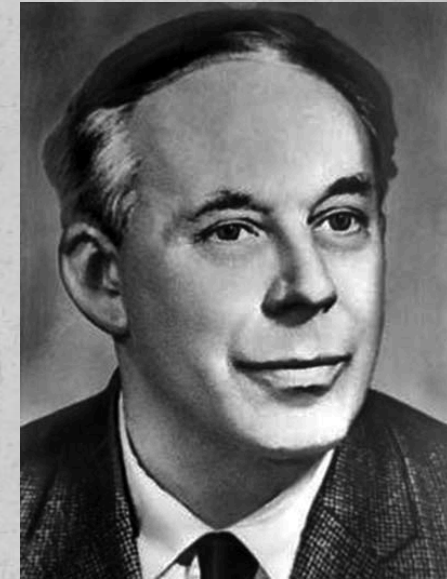
Евгений Федорович Гросс (1897-1972)