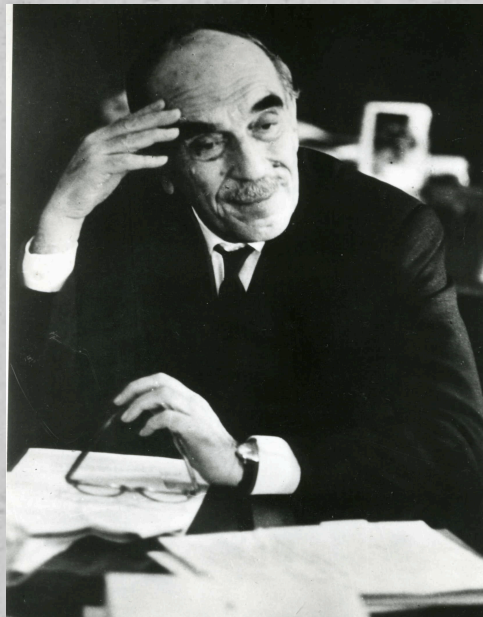
Николай Николаевич Семенов (1896-1986)